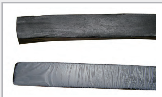
Sammenligning med og uten beskyttelseslag

Regnbeskyttelse 10 dager Trykktett 50 meter vannsøyle